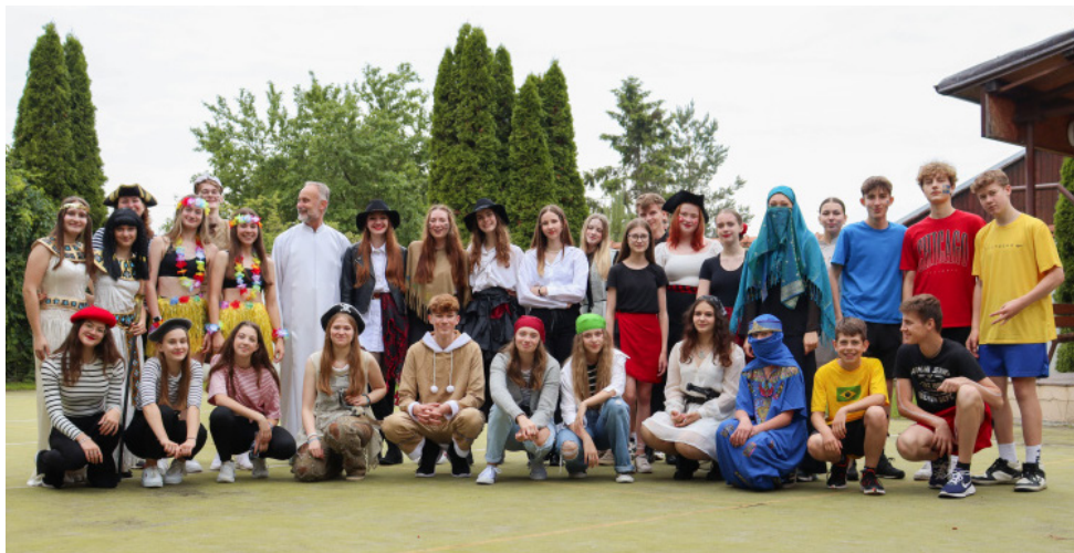
Den dětí připravili členové Školního parlamentu a pomáhali i devátáci