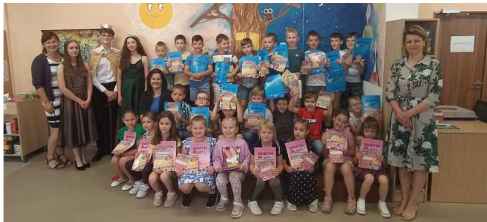
Prvníáci byli slavnostně pasováni na čtenáře