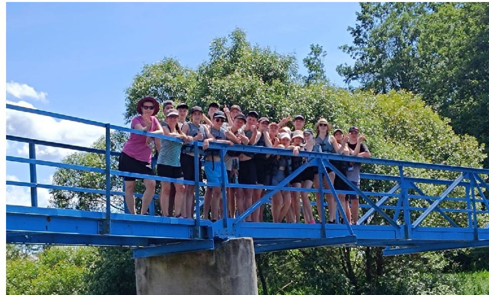
Devátáci na cyklovodáku