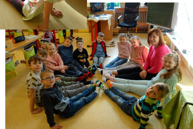
Ponožkový den v prvních třídách