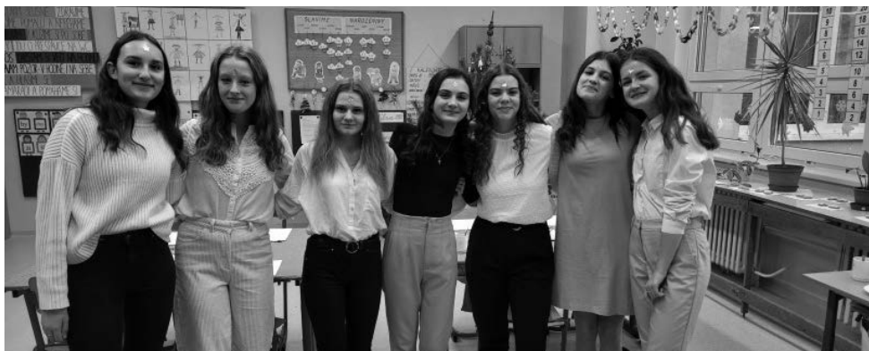
Pomocnice při Ježíškových dílnách