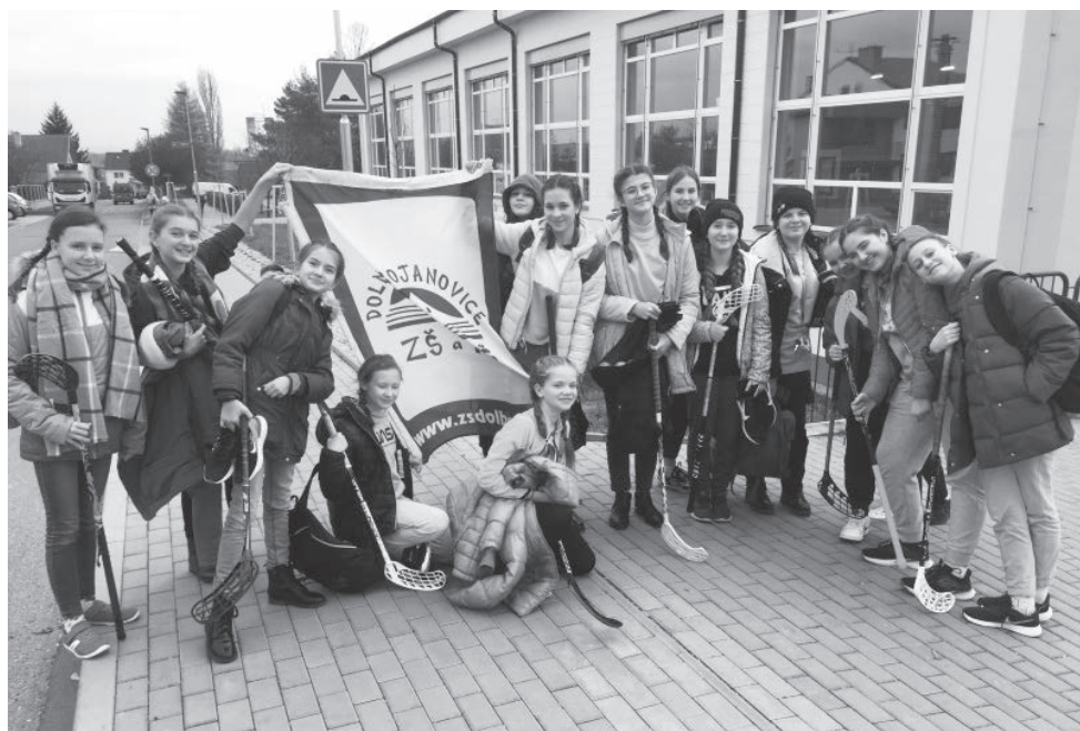
Mladší žákyně postoupily do krajského kola ve florbalu

Paní učitelka se ptá dětí: „Děti, jaké znáte vánoční tradice?“ „Co třeba ty, Pepičku?“ „Třeba polykání kostí.“