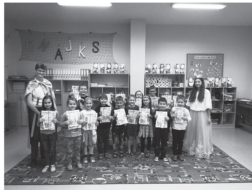
Prvňáčci a jejich Slavnost slabikáře